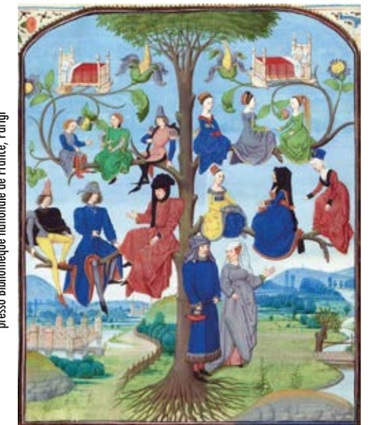
"L'Arbre de Consanguinité". Miniatura di Loyset Liedet nell'opera "la somme rurale" manoscritto nel 1471 di Jean Bouteiller presso Bibliothèque nationale de France, Parigi

LA FAMIGLIA: CULLA DELLA PREVENZIONE E DELLA SOSTENIBILITÀ DELLE CURE