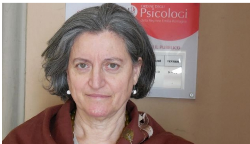
Presidente dell'Ordine degli Psicologi dell'Emilia Romagna